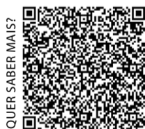
QUER SABER MAIS?